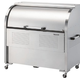
CKS-1307に キャスターセットを 付けた状態