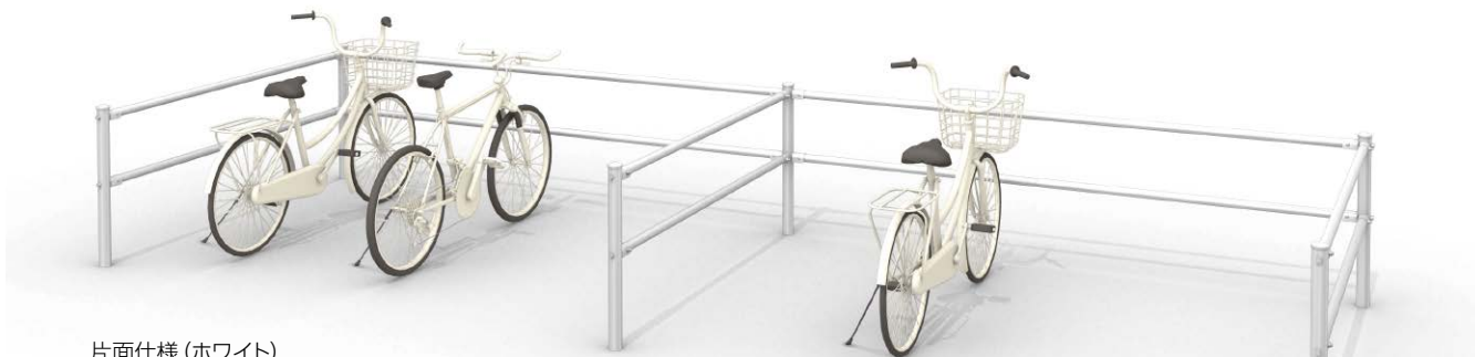
片面仕様 (ホワイト)

パイプを使用した仕切り柵。駐輪エリアの区画作りに最適。間口寸法は2サイズ、奥行寸法は1サイズ。カラーはホワイトとチャイロの2色。