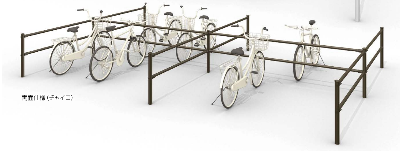
両面仕様 (チャイロ)